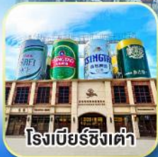
โรงเบียร์ซิงเต่า