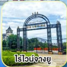
ไร่วินิจฉัยยู