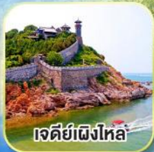
เจดีย์เฝิงไหล