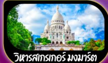
วิหารสกรเทอร์ มงมาร์ต