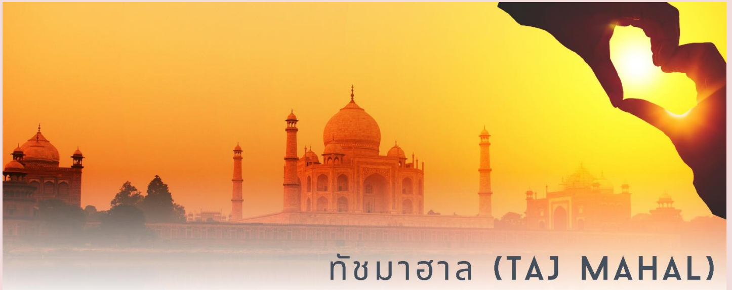
ทัชมาฮาล (TAJ MAHAL)

นำท่านเดินทางชมความงดงามของสถาปัตยกรรม 1 ใน 7 สิ่งมหัศจรรย์ของโลก ทัชมาฮาล (Taj Mahal) อนุสรณ์สถานแห่งความรักที่ยิ่งใหญ่และนิรันดร์ของกษัตริย์ชาฮาร์ฮาลมีต่อพระมเหสี มุมตัส มาฮาล ซึ่งสวรรคตเนื่องจากการให้กำเนิดบุตรคนที่ 14 สถานที่แห่งนี้ใช้สำหรับเป็นที่ฝังพระศพของพระนางมุมตัสและกษัตริย์ชาฮาร์ฮาล ตั้งอยู่บริเวณริมน้ำยมูนา สร้างขึ้นด้วยหินอ่อนสีขาวและหินทรายสี ทัชมาฮาล ได้รับการจดทะเบียนให้เป็นมรดกโลกทางวัฒนธรรม เมื่อปีพุทธศักราชที่ 2526 หรือปีคริสต์ศักราช 1983