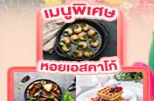
เมนูพิเศษ หอยเอสคาโก้ หอยมัสเซล + วาฟเฟิล