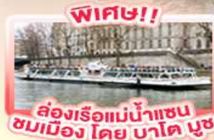
พิเศษ!! ล่องเรือแม่น้ำแซน ชมเมือง โดย บาดู มูช