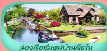
คลองเรือชมหมู่บ้านทอร์น