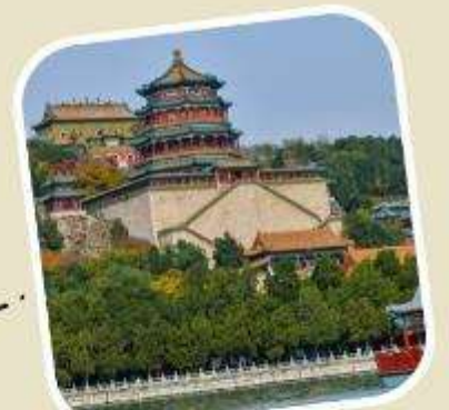
4 พระราชวังฤดูร้อน