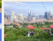
กระเช้าชมเมือง