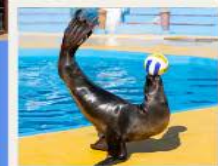
POLAR OCEAN PARK