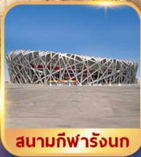
สนามกีฬารังนก