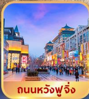
ถนนหวงฟู่จิ่ง