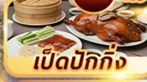
เป็ดปักกิ่ง