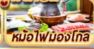
หม้อไฟมองโกล