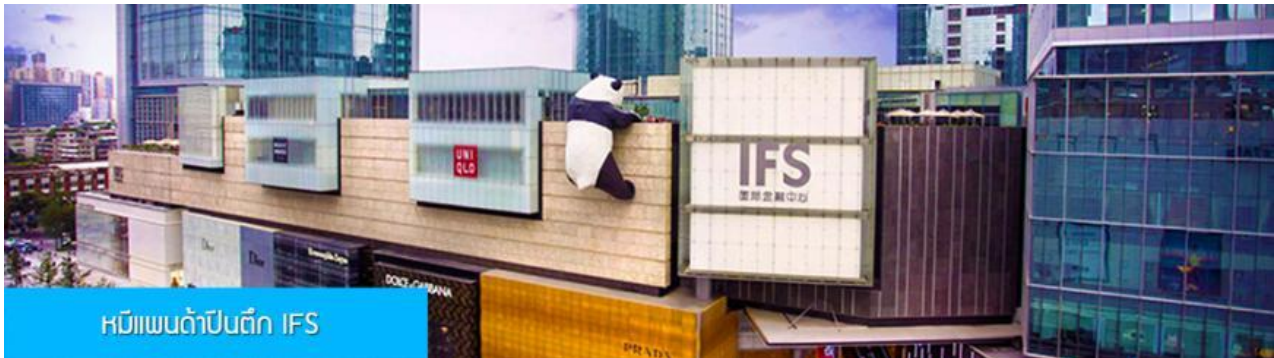
หมีแพนด้าป็นตึก IFS

เที่ยง รับประทานอาหารกลางวัน ณ ภัตตาคาร (14)