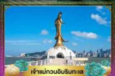
เจ้าแม่ทวนอิมริมทะเล