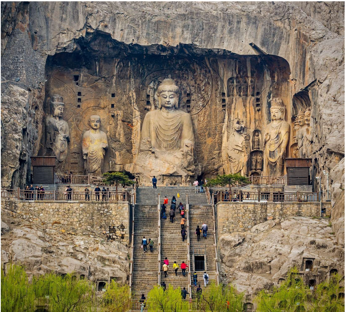
T2G-XIY02(9C) ซีอาน ลั่วหยาง ถ้ำหลงเหมิน หยุนไท่ซาน วัดเส้าหลิน สุสานจีนซี 6D 5N (FD)

ถ้ามีความยาวจากทิศเหนือจรดทิศใต้ประมาณ 1 กม. จัดเป็น 1 ใน 3 แหล่งปฏิมากรรมโบราณที่ประกอบด้วย ถ้ำผาม่อเกาคู ถ้ำผาลงเหมิน และถ้ำผาหยุนกั๋ง ที่มีชื่อเสียงที่สุดในจีน ถ้ำผาลงเหมินแห่งนี้ มีอายุราว 1500 ปี เริ่มก่อสร้างในสมัยราชวงศ์เว่ยเหนือ ค.ศ.494 ใช้ระยะเวลาในการก่อสร้างบูรณะและต่อเติมยาวนานถึง 400 กว่าปี จนถึงยุคราชวงศ์ถังและซ่ง ( ราคาทัวร์รวมรถแบตเตอร์แล้ว )