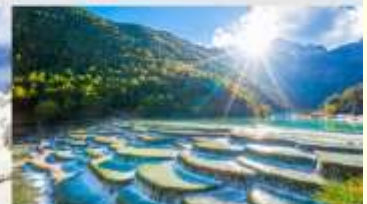
ทะเลสาบไป๋สุ่ยเหอ

*ทางบริษัทฯ ขอสงวนสิทธิ์ในการสลับโปรแกรมทัวร์ตามความเหมาะสมขึ้นอยู่กับสถานการณ์ปัจจุบัน โดยคำนึงถึงผลประโยชน์ของลูกค้าเป็นสำคัญ