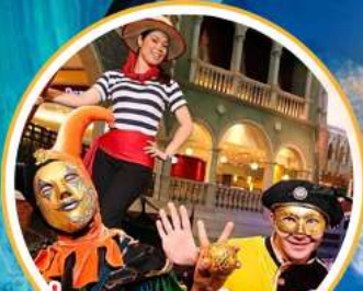
เที่ยวเอเชียแห่งเอเชีย