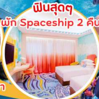
ฟินสุดๆ พัก Spaceship 2 คืน!!