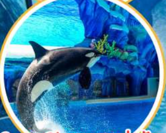
Orca Show สุดน่ารัก