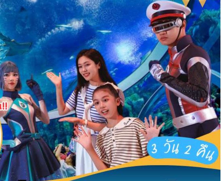
3 วัน 2 คืน