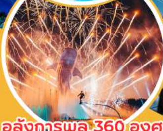
อลังการพลุ 360 องศา