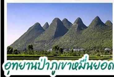
อุทยานป่าภูเขาหมื่นยอด

ทิวทัศน์ตึกร้ายสายน้ำหลังห่อ - ล่องเรือทะเลสาบว่านผิงหู สะพานเทียนฮวาเจียง - อุทยานน้ำพุเทพาหมื่นยอด น้ำตกหวงกู่ - ถนนเก้าคุนหมิง เบบูพิซซ สุกี้หัด ปลายสเปร์ริวเปิด ชมบั้งข้าวสะพาน