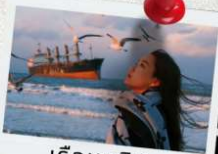
เรือบลูวิส