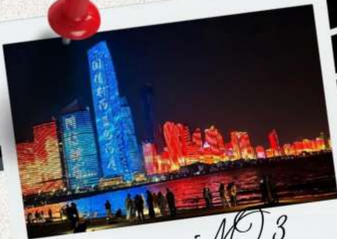
หาดไซเบอร์ MO.3