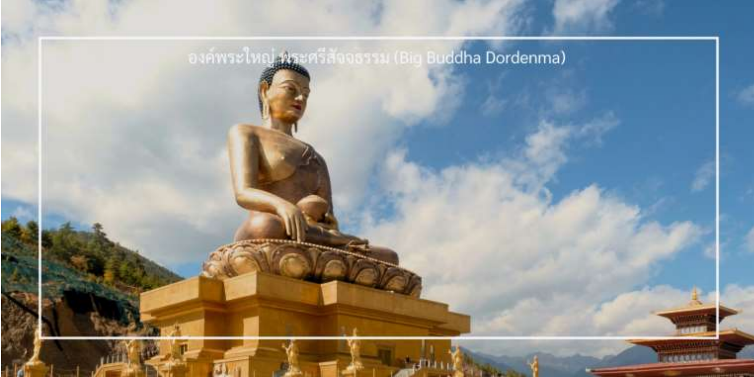
องค์พระใหญ่ พระศรีสัจธรรม (Big Buddha Dordenma)

เที่ยวชม องค์พระใหญ่ พระศรีสัจธรรม (Big Buddha Dordenma) เป็นพระพุทธรูปที่มีความสูงถึง 51 เมตร ตั้งอยู่บนยอดเขาในเมืองทิมพู (Thimphu) ประเทศภูฏาน พระพุทธรูปนี้เป็นหนึ่งในพระพุทธรูปที่ใหญ่ที่สุดในโลก