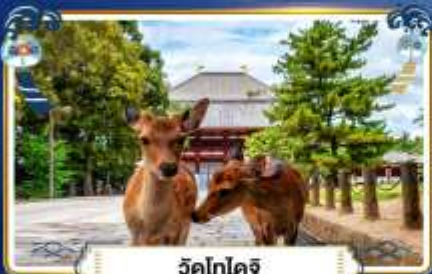
วัดโทไดจิ