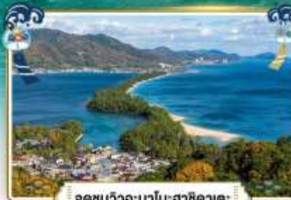
จุดชมวิวงอะมาโนฮาชิคาตะ