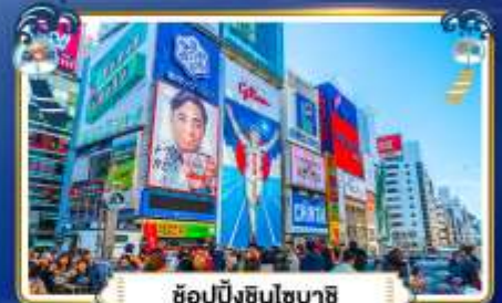
ช้อปปิ้งชินโซบาชิ