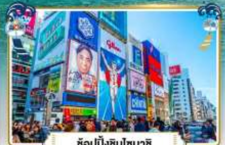
ช้อปปิ้งชินโซบาชิ