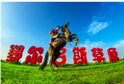
ทุ่งหญ้า เออร์ดอส

พักที่ ORDOS BOYU AIRUI HOTEL โรงแรมระดับ 4 ดาวท้องถิ่น หรือเทียบเท่าในเมืองเออร์ดอส