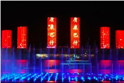
น้ำพุดนตรีคังปาสื่อ