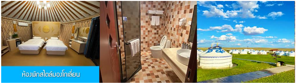
ห้องพักสไตล์มองโกเลีย

พักที่ ORDOS GLASSLAND MONGOLIAN YURT เป็นห้องพักสไตล์มองโกเลีย (กระโจม)