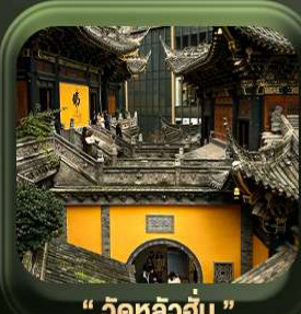
“ วัดหลิวอัน ”