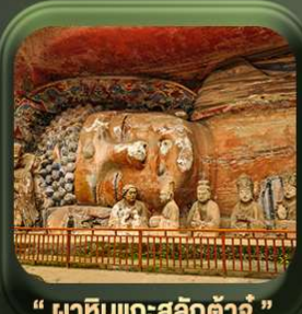
“ พาหินแกะสลักต้าจู้ ”

T2G-CKG26CZ Special of Chongqing...จงซิ่ง ต้าจู้ อุ้หลง อุทยานหลุมฟ้า เขานางฟ้า 5D 3N (CZ)