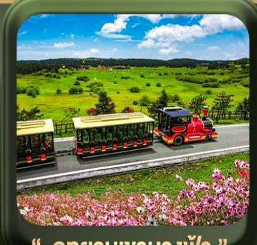
“ อุทยานเขานางฟ้า ”