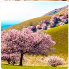
ทุ่งดอกอัลมอนต์