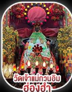
วัดเจ้าแม่กวนอิม สงฮ่า