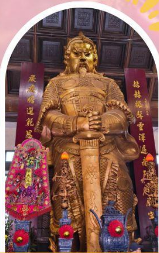
วัดแซกกง ขอพรโชคกลาง การเงิน และธุรกิจ