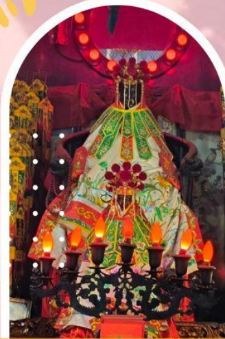
วัดเจ้าแม่กวนอิมฮ่องฮำ ขอพรเรื่องเงิน ทรัพย์สิน และความมั่งคั่ง