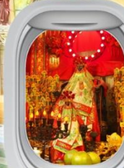
วัดเจ้าแม่กวนอิมฮ่องกง