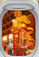
วัดฯชางหมิว