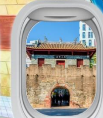
เมืองโบราณหนานก๊ว