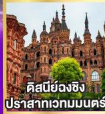
คิสนีย์ยงฉิ่ง ปราสาทเวกมมนคร