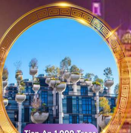
Tian An 1,000 Trees