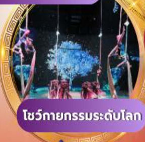
โชว์กายกรรมระดับโลก