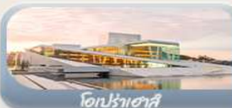
โอปราเฮาส์

สักครั้งในชีวิตกับการนั่งรถไฟสายโรแมนติกฟลัมสบนาน่า สองเรือชมฟยอร์ด ขึ้นกระเช้าลอยฟ้าพิชิตยอดเขาอูสริเคน เบอร์เกน นั่งรถรางสวยอดเขาฟลอมอนชมวิวเมือง ออสโล เยี่ยมชมโอปราเฮาส์ มหาวิหารออสโล ป้อมปราการอาครส์ฮูส สวนอนุสรณ์ชาติ Vigeland Sculpture Park