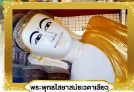
พระพุทธรูปไสยาสน์ชเวดากอง