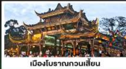
เมืองโบราณทวนเสียน