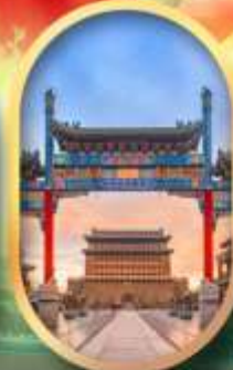
ถนนคนเดินเทียนเหมิน