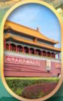
จัสมุตรีสเทียนอันเหมิน