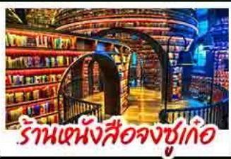
ร้านหนังสือจุงชู่เกอ