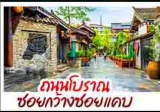
ถ่านบิราถน ชอยกวางชอยแคบ