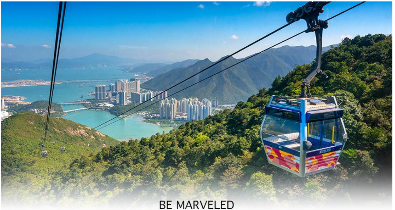
BE MARVELED กระเช้านองปิง

ล่าง ซึ่งการเดินทางขึ้นไปสักการะองค์พระใหญ่อย่างใกล้ชิดนั้น ต้องเดินขึ้นบันได จำนวน 268 ขั้นและได้รับเลือกให้เป็นสิ่งมหัศจรรย์ทางวิศวกรรมขั้นที่ 4 จากทั้งหมด 10 ชั้นของฮ่องกงในปี ค.ศ. 2000 ถือเป็นพระพุทธรูปองค์ใหญ่ที่เป็นสุดยอดของประติมากรรมทางพุทธศาสนาที่มีการผสมผสานระหว่างศิลปะสำริดแบบดั้งเดิมกับเทคโนโลยีสมัยใหม่ ชาวฮ่องกงเชื่อว่า หากใครได้มานมัสการขอพรองค์พระใหญ่แห่งนี้แล้ว ชีวิตก็จะมีแต่ความโชคดี มีความสุขสมหวัง และประสบความสำเร็จในทุกๆ ด้าน หลังจากไหว้พระแล้วท่านสามารถเลือกซื้อของฝาก, ของที่ระลึก จากหมู่บ้านนองปิง อาทิเช่น หยก ไข่มุก หรือเครื่องประดับคริสตัล เพื่อเป็นของที่ระลึก จากนั้นนั่งกระเช้ากลับลงมายังสถานีตุ่งซุง