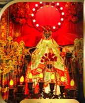
เจ้าแม่กวนอิม ฮ่องฮ่า