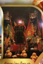
วัดบ้านใหม่