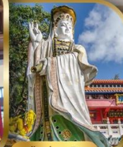
เจ้าแม่กวนอิม ริพลัสเบย์