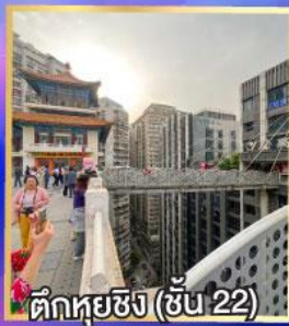
ตึกหุ่ยซิง (ชั้น 22)