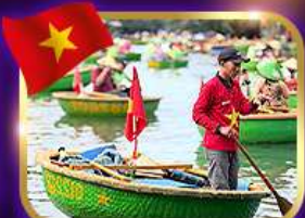
เรือกระด้ง หมู่บ้านก๊อ๊กทาน