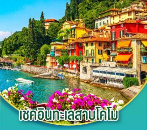
เซคอินทะเลสาบโดโม