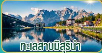
ทะเลสาบมิสุร์น่า