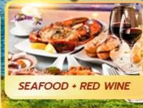
SEAFOOD + RED WINE