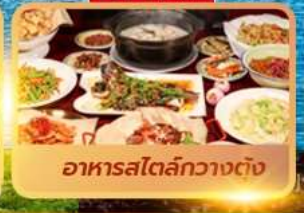
อาหารสไตล์กวางตุ้ง