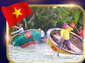
ล่องเรือกระดิว หมู่บ้านกัมกาน