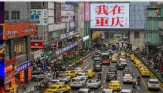
กวนอิมเจียว

*ทางบริษัทฯ ขอสงวนสิทธิ์ในการสลับโปรแกรมทัวร์ตามความเหมาะสมขึ้นอยู่กับสถานการณ์หน้างาน โดยคำนึงถึงผลประโยชน์ของลูกค้าเป็นสำคัญ