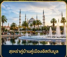
สุเหร่าบ้านคูเมืองอิสตันบูล