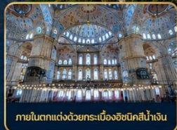
ภายในตกแต่งด้วยกระเบื้องอิสตันบูลสีน้ำเงิน