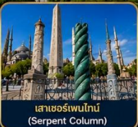
เสาฮอร์เพนไทน์ (Serpent Column)