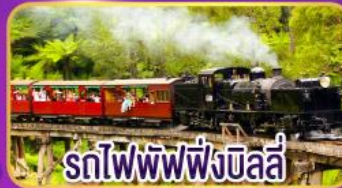
รถไฟพัพฟิงบิลลี่