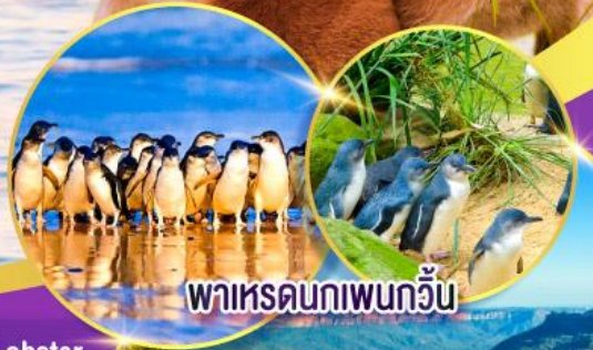
พาหรดนทเพนกวิน

ล่องเรือชมอ่าวซิดนีย์พร้อมรับประทานอาหารกลางวัน และเข้าชมสวนสัตว์ทารองก้า