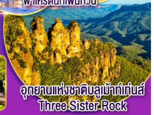
อุทยานแห่งชาติบลูเมาท์เทนส์ Three Sister Rock