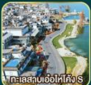
ทะเลสาบเอ๋อไห่คัง S