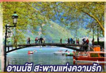
อานน์ซี สะพานแห่งความรัก