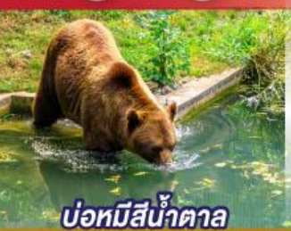
บ่อหมีสีน้ำตาล