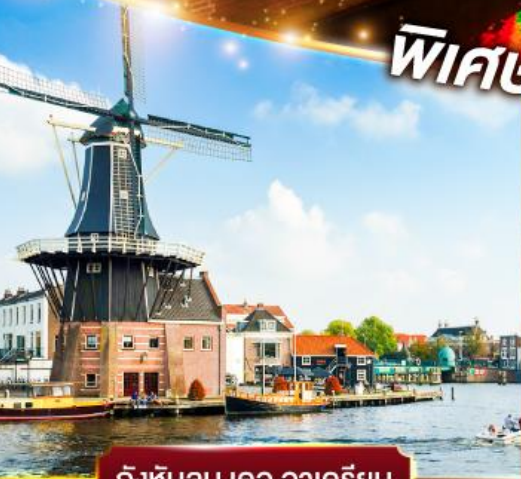
กังหันลม เดอ อาครีเยน