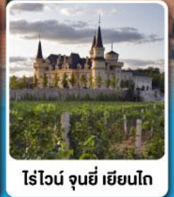
ไร่ไวน์ จุนยี่ เยียนไถ