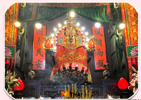
นางฟ้าพามู

จากนั้นเดินทางไปต่อที่ วัดทินหัว (วัดเจ้าแม่ทับทิม) เป็นวัดเก่าแก่ในฮ่องกง สมัยก่อนฮ่องกงเป็นหมู่บ้านชาวประมง ซึ่งคนจะให้ความเคารพนับถือเจ้าแม่ทับทิมทินหัวเป็นอย่างมาก เพราะเชื่อว่าเป็น เทพีแห่งท้อง