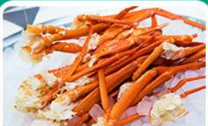
พิเศษ! บุฟเฟ่ต์ขาปู