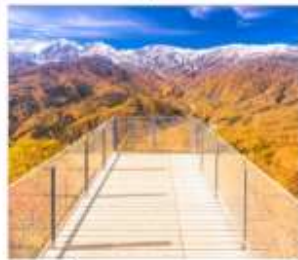
นั่งกระเช้าฮาคูมะ