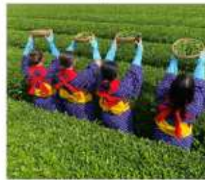
กิจกรรมเก็บชาみやโนเซ็น