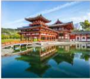
วัดเมียวโตจินและ ถนนซาเจียว