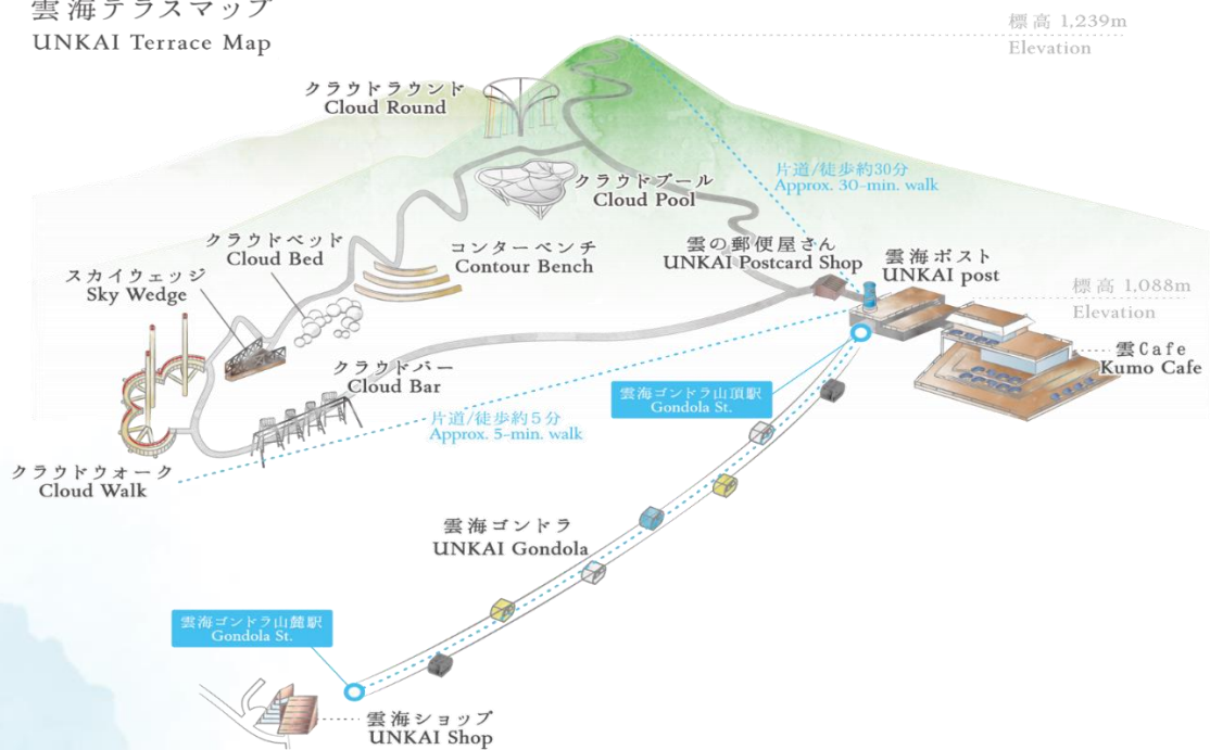
雲海テラスマップ UNKAI Terrace Map

เดินทางสู่ เมืองอาซาฮิคาว่า เป็นเมืองที่ใหญ่เป็นอันดับสองของเกาะฮอกไกโด รองจากนครซัปโปโระมีร้านค้าที่ขายข้าวและผักที่ปลูกได้ในเมือง และยังมีร้านขายอาหารทะเลตั้งอยู่มากมาย การคมนาคมสมบูรณ์แบบ ทำให้แต่ละปีมีผู้มาท่องเที่ยวกว่า 5 ล้านคนจากทั้งในและต่างประเทศ