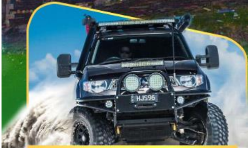
คันรถ 4WD สู้อีกกลางเทือกเขาคอเคซัส