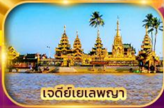
เจดีย์เยเลพญา