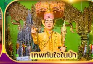
เทพทันใจในป่า