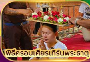
พิธีครอบเศียรเทรินพระธาตุ