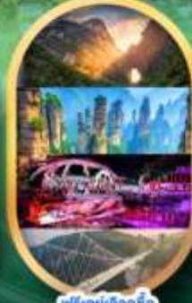
ฟรีคีย์เลือกซื้อ Option เสริม