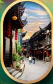
เมืองโบราณฟูหลงเจิน

✘ ไม่รวม ค่าใช้จ่ายเงินเขา เทียมเหมินซาน