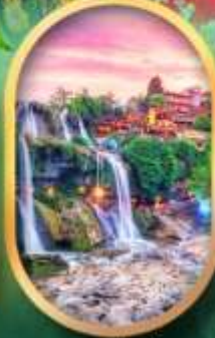
ฟูหลงเจินน้ำตก