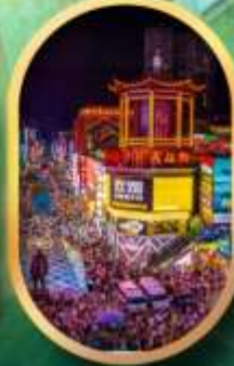
ถนนคนเดินซิงสวี่