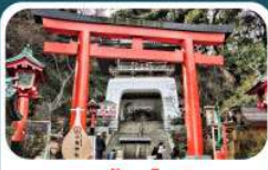
ศาลเจ้าอิเนะชิมะ